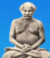
గురు లాహిరి మహాశయ