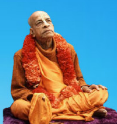
గురు భక్తవేదాంత ప్రభుపాద