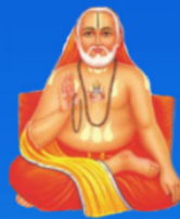
గురు రాఘవేంద్ర స్వామి