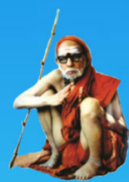
గురు చంద్రశేఖర పరమాచార్య