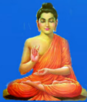
గురు గౌతమీ బుద్ధ